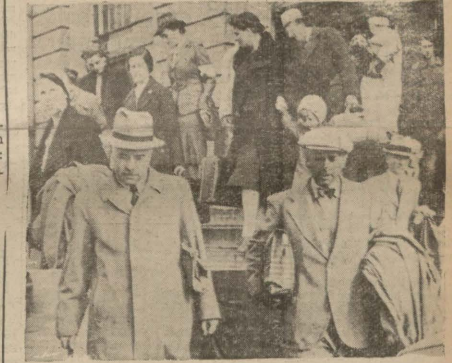
Dün şehrimize gelen Almanyanın Tahran büyük elçisi ile Alman kolonisi Haydarpaşa İstasyonundan çıkarken

Dün Almanyanın Tahran Büyük Elçisi geldi, bugün de İtalyan Sefiri geliyor