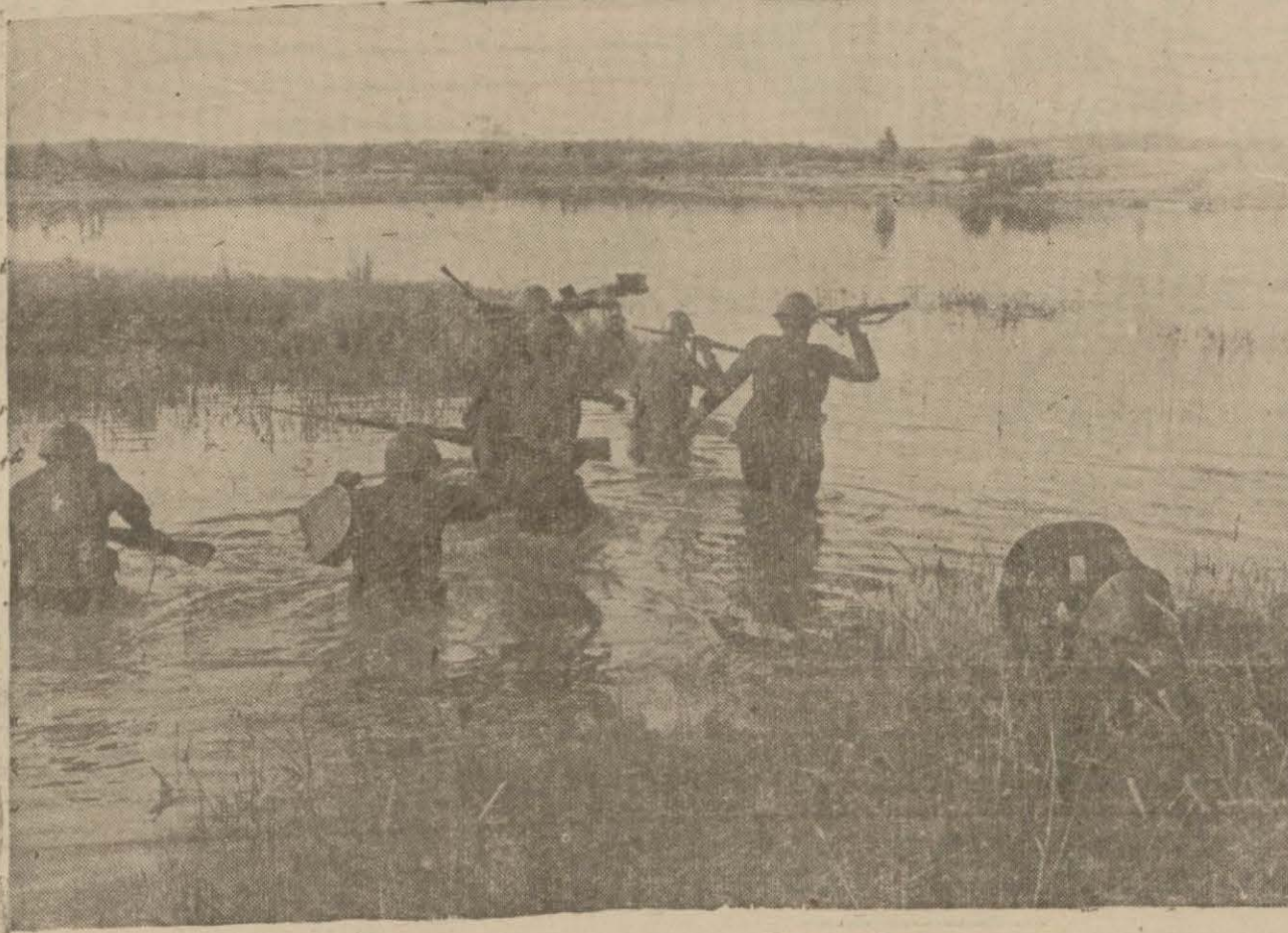
Sovyet askerleri bir ırmağı geçerken

Odesa el'an kaya gibi mukavemet etmektedir.