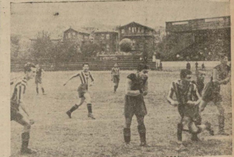
Fenerbahçe - Beyoğluspor maçından heyecanlı bir sahne. İstanbul lig maçlarına dün Kadıköy lîb gelmesine mukabil, G.atasaray ve Şeref sahasında devam edildi. Vefayı şükütlü bir oyundan sonra 1-0 Fenerbahçe ve Beşiktaşın kolaylıkla ga. (Devamı 2 inci sayfada)

Fenerbahçe Beyoğlusporu 6-1, G. Saray Vefayı 1-0, Beşiktaş Süleymaniyeyi 6-0 yendiler